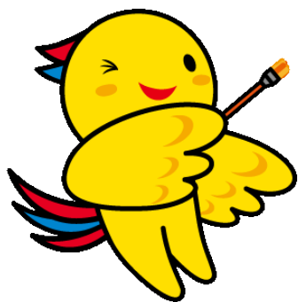
兵庫県マスコットはばタン