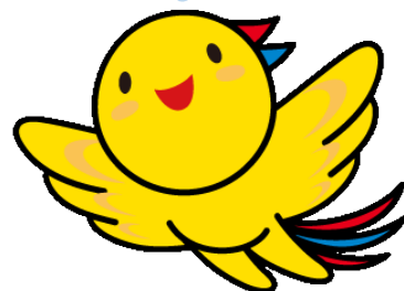
兵庫県マスコットはばタン