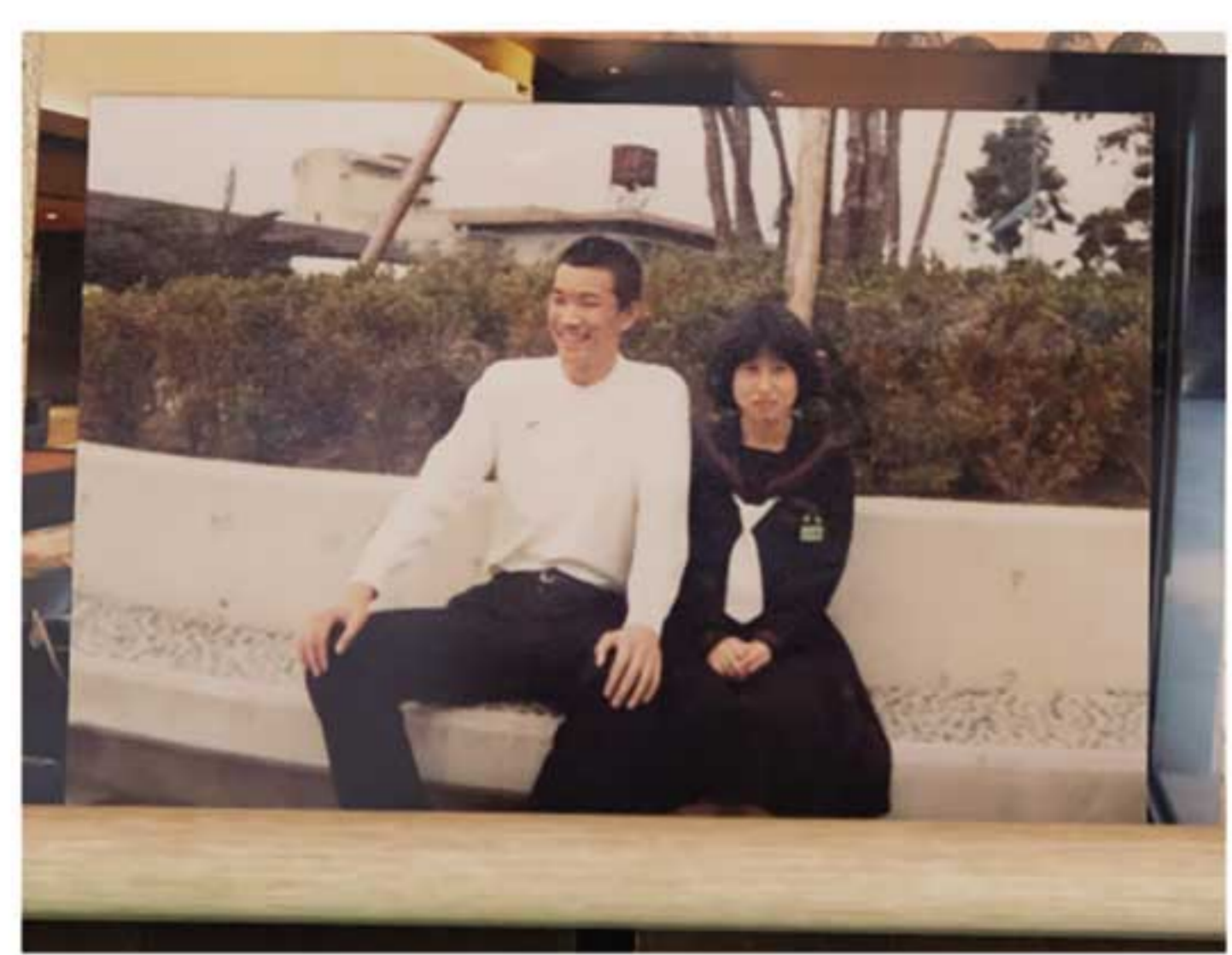
中学生の頃のお二人

仕事スペースに飾られていたお二人の中学生時代のツーショット写真とお付き合いが始まった頃の仲睦まじい写真が、長い年月のなかで大切に育まれてきた絆を物語っていました。