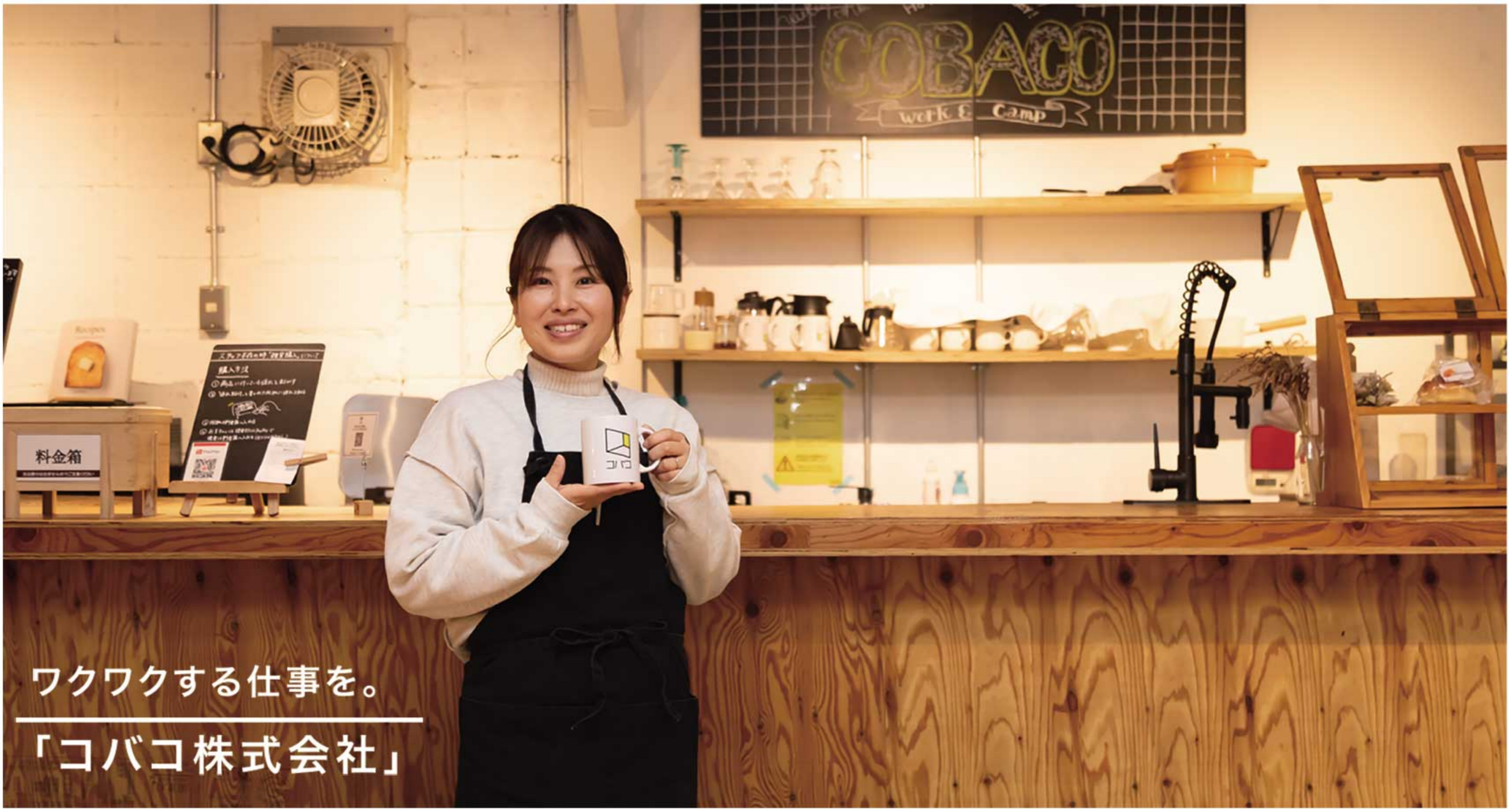
ワクワクする仕事を。 「コバコ株式会社」