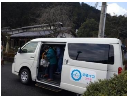
「のるイコつやま」利用風景

津山駅や東津山駅等10箇所に貸し借りができるポートを設置し、「ごんちゃり」を35台配置している。駅からの二次交通や市内の周遊で利用がある。