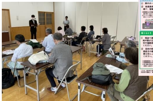
公共交通乗り方教室 （公民館での座学）