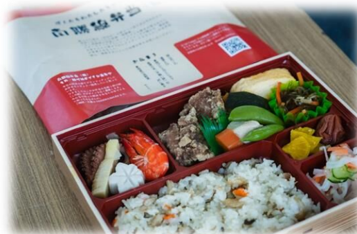
利用促進イベントイメージ (過去実施例)