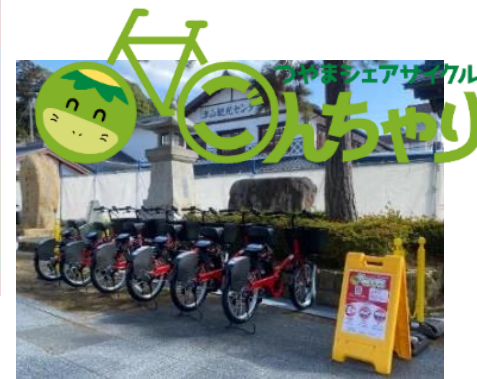
つやまシェアサイクル 「ごんちゃり」