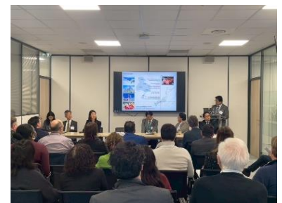
兵庫県のプレゼンテーションの様子