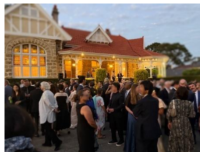
パース総領事公邸における レセプションの様子