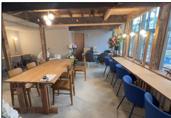
ユキヒラやねやね (神戸市) (③木製品導入)