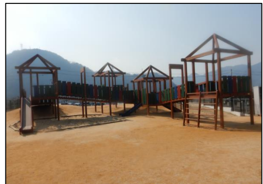
まあるこども園(宍粟市) (③木製品導入)