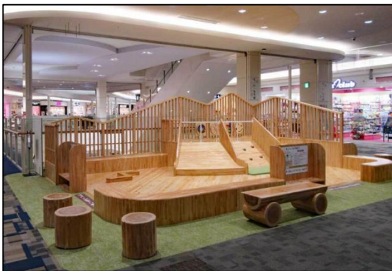
イオンモール神戸北 (神戸市) (① 室内木質化 : 床部分)