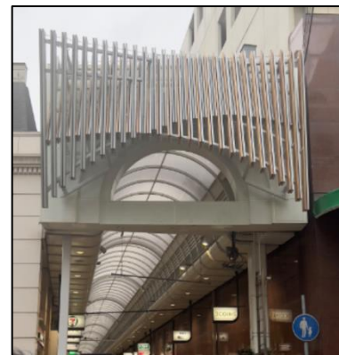
三宮本通商店街ファサード (神戸市) (② 屋外木質化)