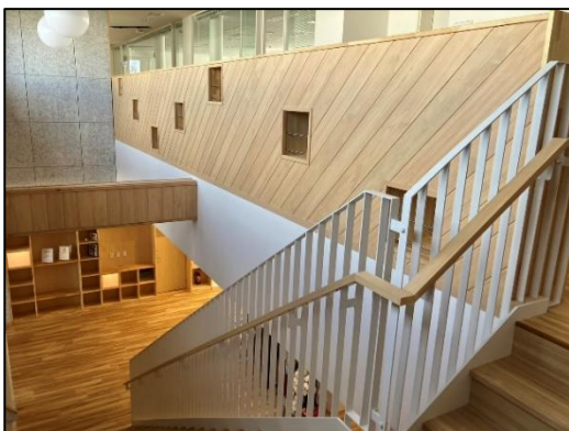
多可町商工会 (多可町) (① 室内木質化)