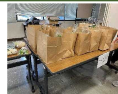
兵庫県庁でのCSAを試行 (月1回で3ヶ月間)