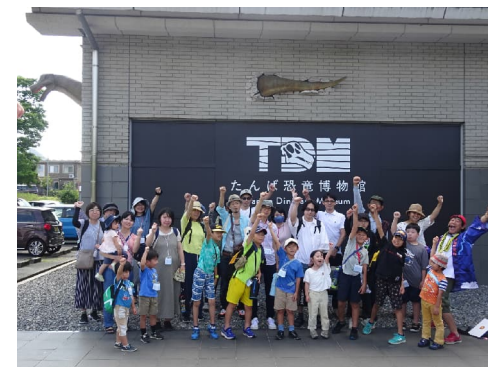
丹波地域（たんば恐竜博物館）