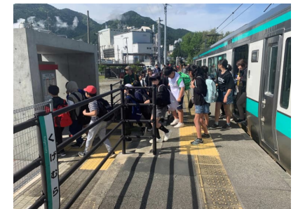
西脇小学校による遠足利用