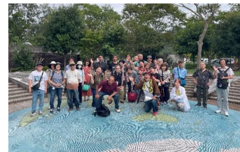
北播磨地域（日本へそ公園）