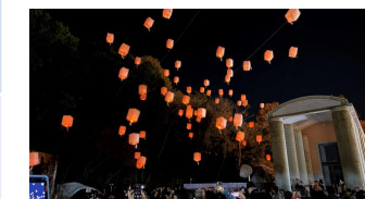
リレーマルシェ×空飛ぶランタン