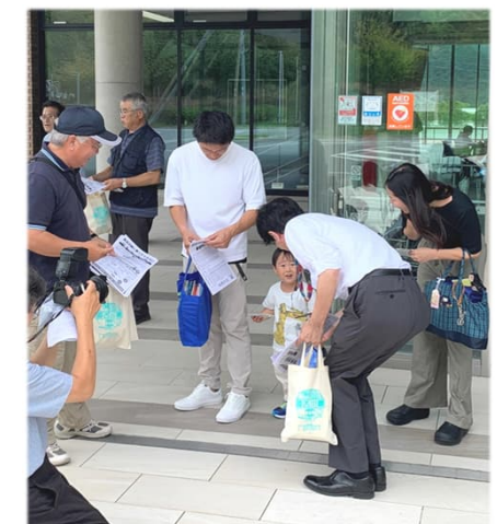
啓発チラシ配布(みらいえ)