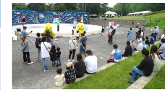
北播磨かんきょうフェスタ