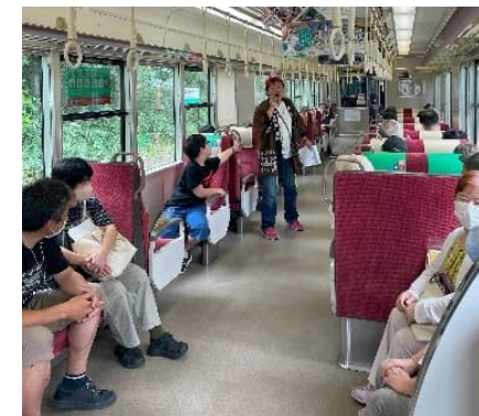
電車内トークイベント