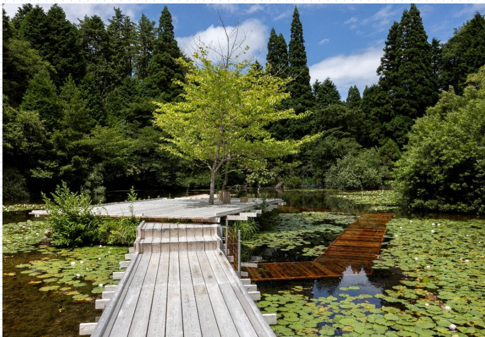
川俣正《六甲の浮き橋とテラス エクステンドブリッジ アンド テラス》

各日所要時間：9時30分～16時 9時30分 JR六甲道駅三井住友銀行 灘支店前集合（解散もJR六甲道駅）