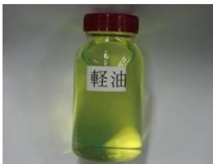
正常な軽油 (半透明または薄黄色)