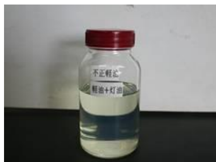
不正軽油 (灯油+軽油) (透明)