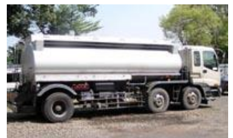
無印のタンクローリー