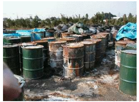
放置されたドラム缶 (腐食が進み危険な状態)

→ 不正軽油の製造が行われている可能性があります。場合によっては、人体に有害なガス等が発生する可能性もあり、非常に危険です。