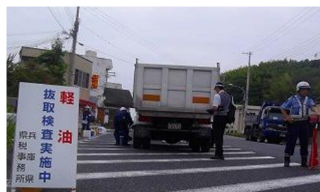
路上軽油抜取調査 平成 29 年 6 月 淡路市内