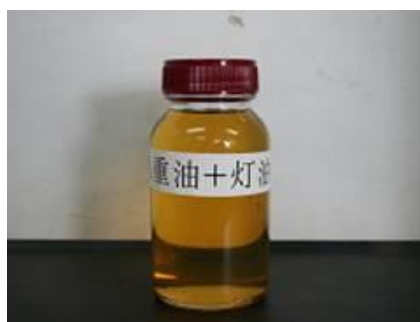
不正軽油 (重油+灯油) (茶色がかった色)