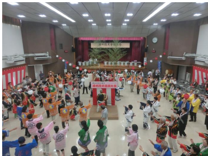
【播州段文音頭大会】