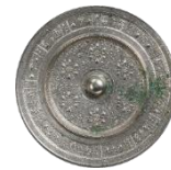
だんかもんきょう 団華紋鏡