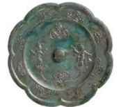
れんじょうからこもんはなびしきょう 蓮上唐子紋八花鏡

問合せ先 兵庫県立考古博物館 加西分館「古代鏡展示館」 〒679-0106 加西市豊倉町飯森 1282-1(兵庫県立フラワーセンター内) TEL 0790-47-2212 FAX 0790-47-2213 【 https://www.hyogo-koukohaku.jp/kodaikyou/ 】