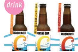
明石ビール 7種の生ビール