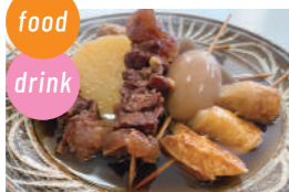
しのぶ食堂 中華そば、おでん