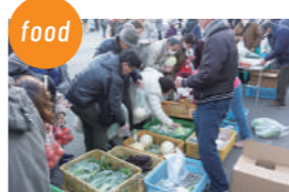
いなみ朝市実行委員会 野菜等の販売