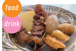
しのぶ食堂 中華そば、おでん