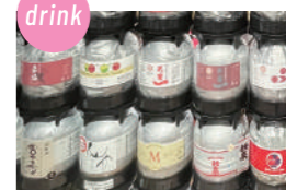
ケグドラフト 県内のKEG DRAFT SAKE (日本酒) 8種