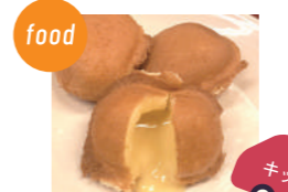
明石夢工房 半熟カステラ福玉焼