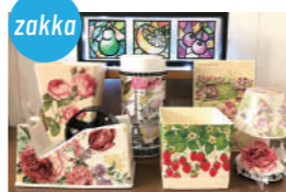
A Little More ハンドメイド雑貨、リメイク作品