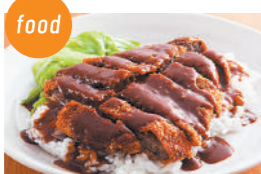
うまいでえ! 加古川かつめしの会 加古川かつめし、かつめしのタレ