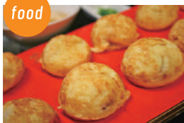
あかし玉子焼ひろめ隊 あかし玉子焼、玉焼