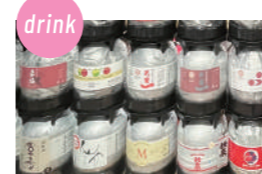
ケグドラフト 県内のKEG DRAFT SAKE (日本酒) 8種