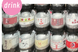
ケグドラフト 県内のKEG DRAFT SAKE (日本酒) 8種