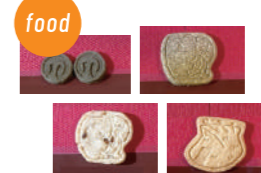
就労継続支援B型事業所シズル 播磨町名産クッキー