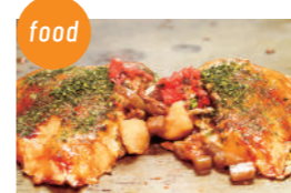
高砂にくてんの会 高砂にくてん