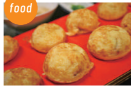
あかし玉子焼ひろめ隊 あかし玉子焼、玉焼