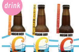
明石ビール 7種の生ビール