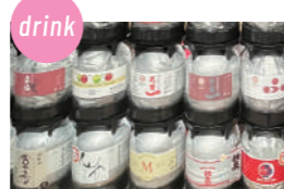
ケグドラフト 県内のKEG DRAFT SAKE (日本酒) 8種