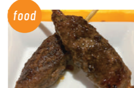
はやりや はりま牛つくね 神戸ポークつくね