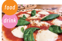
ハイダウェイ ピザ、窯焼きウインナー、かき水