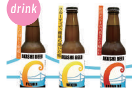
明石ビール 7種の生ビール