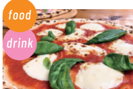
ハイダウェイ ピザ、窯焼きウインナー、かき水

PR 加古川観光協会 明石市、明石観光協会、明石商工会議所 高砂市観光交流ビューロー