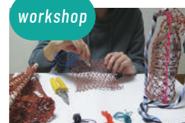
neo-wave 役割を終えた漁網を使ったワークショップ