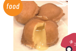
明石夢工房 半熟カステラ福玉焼