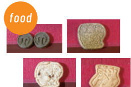
就労継続支援B型事業所シズル 播磨町名産クッキー