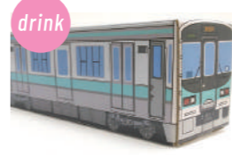
長谷川商店 丸粒バック麦茶(精白大麦) 電車茶箱鉄茶