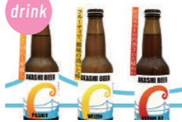
明石ビール 7種の生ビール