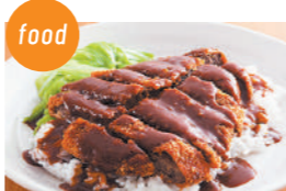
うまいでえ! 加古川かつめしの会 加古川かつめし、かつめしのタレ