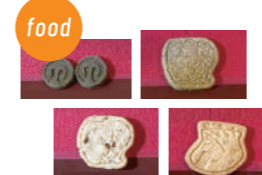
就労継続支援B型事業所シズル 播磨町名産クッキー