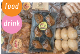
燻製屋たかさご食彩縁 燻製、かきのお好み焼き、いか焼き