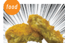
和牛うらい 神戸ビーフコロッケ 神戸ビーフミンチカツ