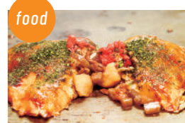
高砂にくてんの会 高砂にくてん