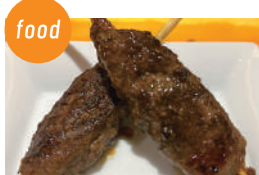
はやりや はりま牛つくね 神戸ポークつくね