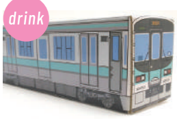
長谷川商店 丸粒バック麦茶(精白大麦) 電車茶箱鉄茶