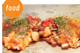
高砂にくてんの会 高砂にくてん