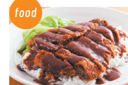
うまいでえ! 加古川かつめしの会 加古川かつめし、かつめしのタレ