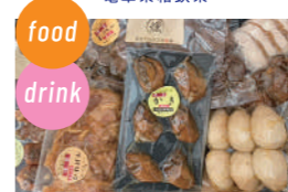
燻製屋たかさご食彩縁 燻製、かきのお好み焼き、いか焼き