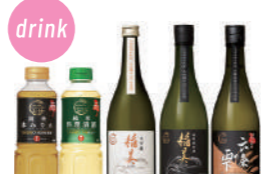
キング醸造(株) 福美町産本みりん、福美町産料理清酒 大吟醸福美