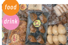
燻製屋たかさご食彩縁 燻製、かきのお好み焼き、いか焼き