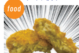
和牛うらい 神戸ビーフコロッケ 神戸ビーフミンチカツ