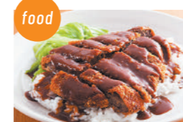
うまいでえ! 加古川かつめしの会 加古川かつめし、かつめしのタレ