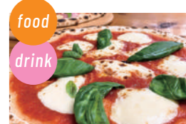
ハイダウェイ ピザ、窯焼きウインナー、かき水