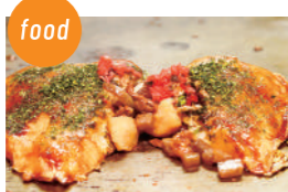
高砂にくてんの会 高砂にくてん