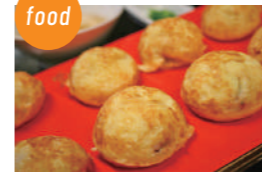
あかし玉子焼ひろめ隊 あかし玉子焼、玉焼