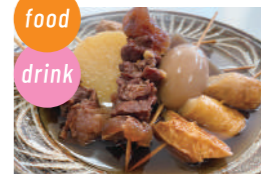
しのぶ食堂 中華そば、おでん