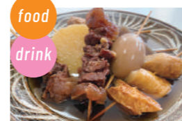
しのぶ食堂 中華そば、おでん