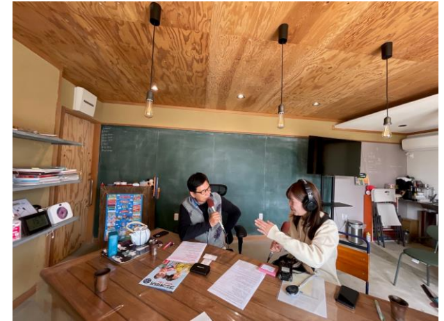
ラジオ取材の様子

ラジオやSNS等を活用し、沿線地域の観光資源を一つのストーリーでつなげ、その交通手段としての自転車の魅力をPRする。合わせてスポーツサイクリング愛好者に向けては、ひょうごサイクリングモデルルート「銀の馬車道・鉱石の道周遊ルート」の魅力をPR（日本遺産「銀の馬車道・鉱石の道」推進協議会総会承認後実施）