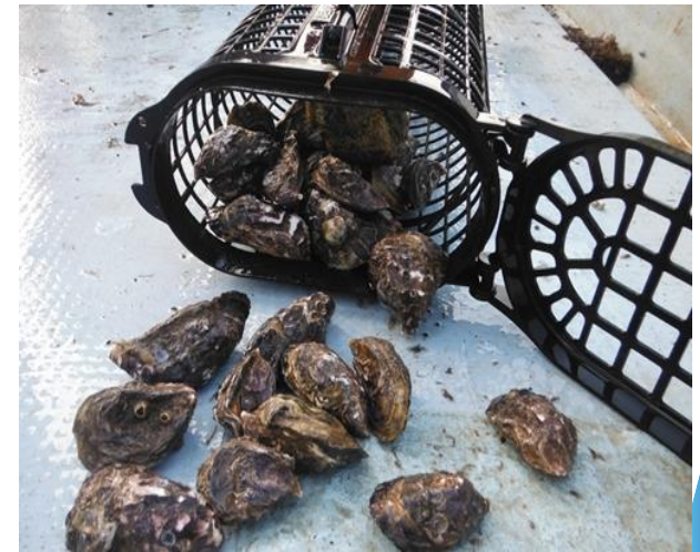
シングルシードマガキ養殖