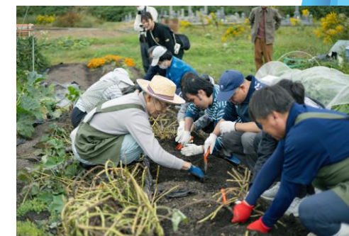
ユニバーサル農園