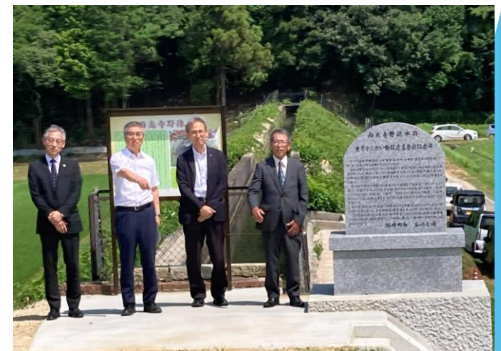
記念碑除幕式の様子