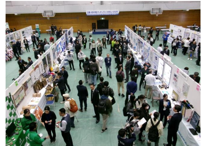
企業・大学・学生マッチングin HIMEJI

地元企業の製品・技術や、大学の研究等の展示を行うことにより、学生に地元企業の製品・技術をPRするとともに、学生に出展企業の製品・技術情報や、企業との意見交換の機会を提供し、地元企業への関心を高めてもらうことを目的に、「企業・大学・学生マッチング in HIMEJI 2026」を開催