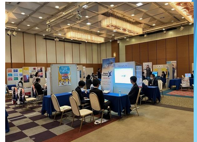
大学生対象企業研究会