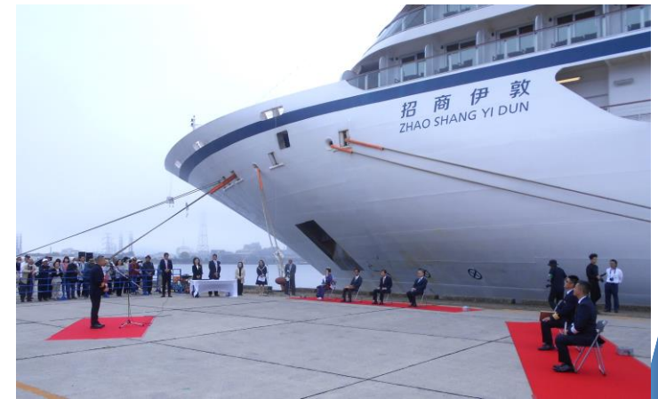
クルーズ客船入港時の歓迎式典

クルーズ客船寄港時にSOLAS条約（海上における人命の安全のための国際条約）に則った体制強化のための設備を整備し、一般市民の誘客による港の賑わいづくりを図る。