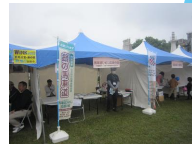
ブース出展イメージ（左）FPフェス（右）姫路港ふれあいフェスティバル