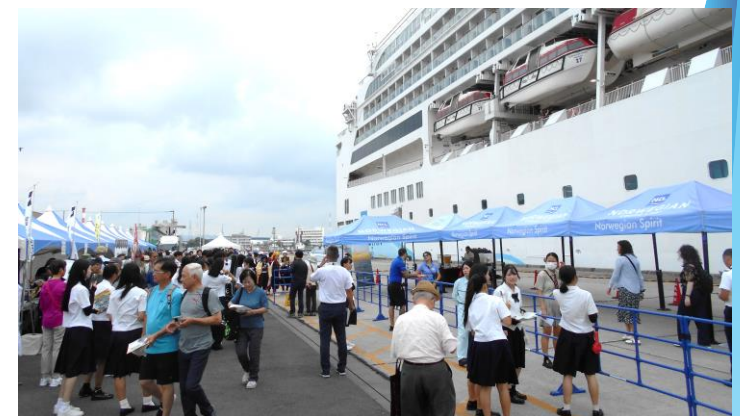
入港時の歓迎の様子