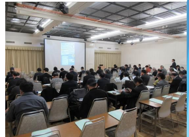
ものづくり企業経営力向上セミナー

ものづくり企業を取り巻く環境は、カーボンニュートラル、SDGsの視点、循環経済（サーキュラーエコノミー）など劇的に変化している。これらの課題に対応するためには、最新のテクノロジーや社会課題等を習得するとともに、企業同士、企業と大学等研究機関との連携を強化することが重要である。そこで、最新の経営課題への対応方法を学ぶセミナーや意見交換会を開催