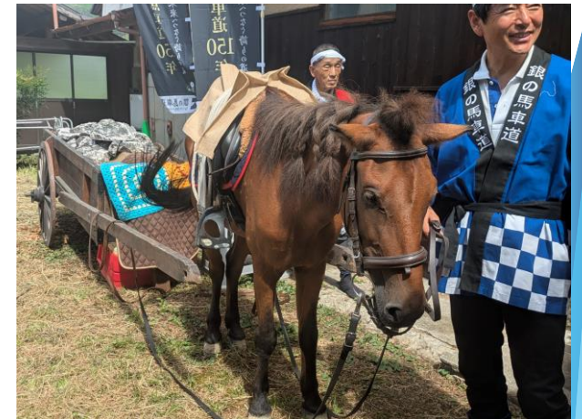
公式キャラクターに扮したポニー

各種観光イベントにおいて、銀の馬車道公式キャラクターに扮したポニーを登場させ注目を集める。また、キャラクターの情報をSNSで発信することによりフォロワー数のさらなる増加を図る。