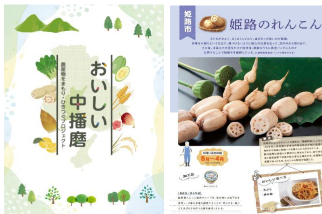
農産物PRパンフレット