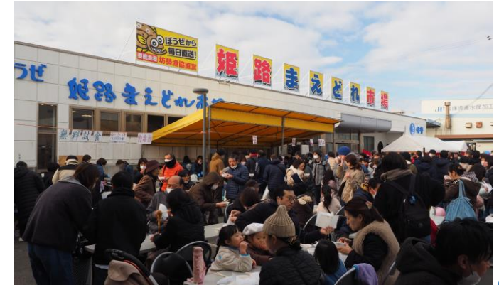
JFぼうぜ・姫路まえどれ市場

海業とは、海や漁村の地域資源の価値や魅力を活用し、地域のにぎわいや所得、雇用を生み出すことを目的とした事業や取組