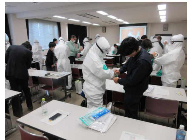
防護服着脱訓練の様子

流行期を控える秋頃に、中播磨地域重大家畜伝染病連絡協議会を開催し、発生を想定した防疫措置対応や、各事務所の具体的な役割分担等について確認する。また、県民センターに加えて、農林水産部畜産課や姫路家畜保健衛生所が参加する机上演習や防疫作業員向けの防護服着脱訓練等を実施