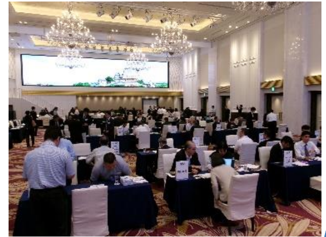
進路指導担当と企業の交流会