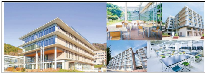
兵庫県立大学 姫路工学キャンパス